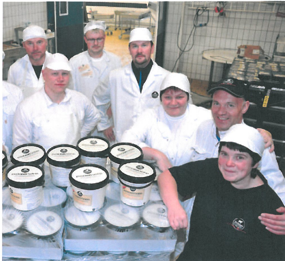
PARADEPRODUKT: Stort sett hele staben ved Inderøy Slakteri samlet rundt paradeproduktet.

I tillegg så kan du enkelt gå inn på bedriftens soddkalkulator (som også ligger på hjemmesiden), og her legger du bare inn hvor mange dere blir til middag, så beregner kalkulatoren hvor mye Inderøysodd, potet, gulrot og skjening du trenger til måltidet. Appen er ikke ferdig utviklet, men man har forhåpninger om at den kan presenteres før jul.